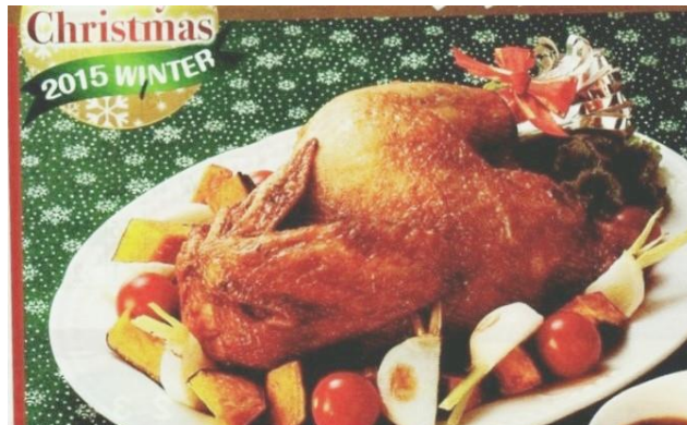
定番 ローストチキン 半身 P2 651 1650円