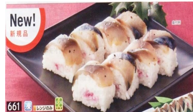
新製品 スモークサバの小袖SUSHI P3 661 900円