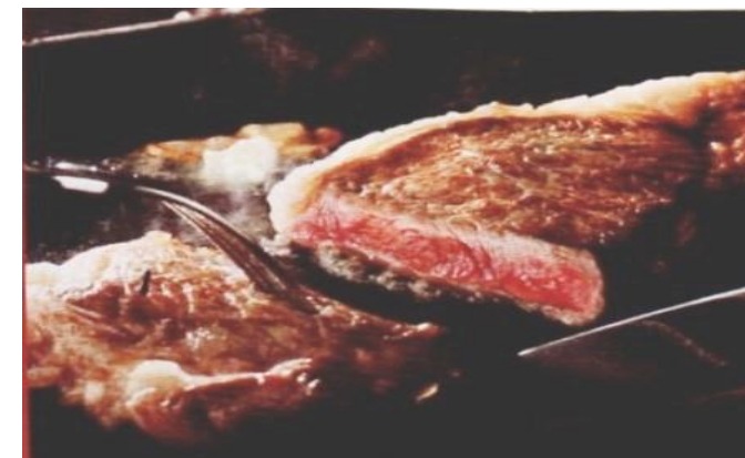
冷凍 牛肉サーロインステーキ P2 653 2150円