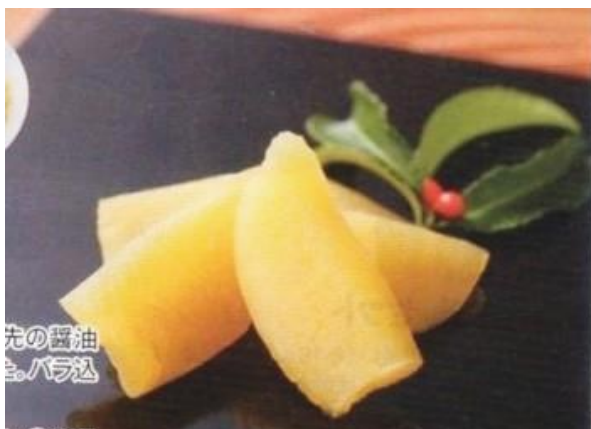
北海道産 味付け数の子 P8 763 2120円