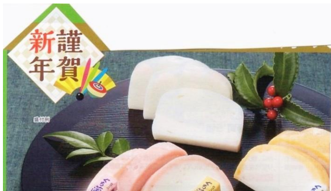
定番 ぐちかまぼこ3種 P8 765, 766, 767 770円